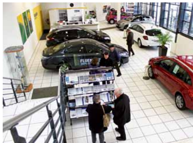
Bei der Wolgensinger AG hat der Autofrühling mit der Ausstellung vom vergangenen Wochenende bereits erfolgreich begonnen.