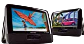
Philips Car DVD Player System Filmvergnügen für unterwegs Preis Fr. 429.–