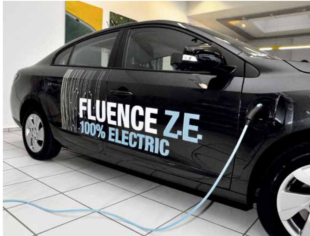
Dank des mit dem Fahrzeug gelieferten Ladekabels kann man die öffentliche oder private Ladestation für die Standard- oder die beschleunigte Aufladung nutzen. Für die Schnellladung stehen an Ladestationen spezielle Kabel zur Verfügung.