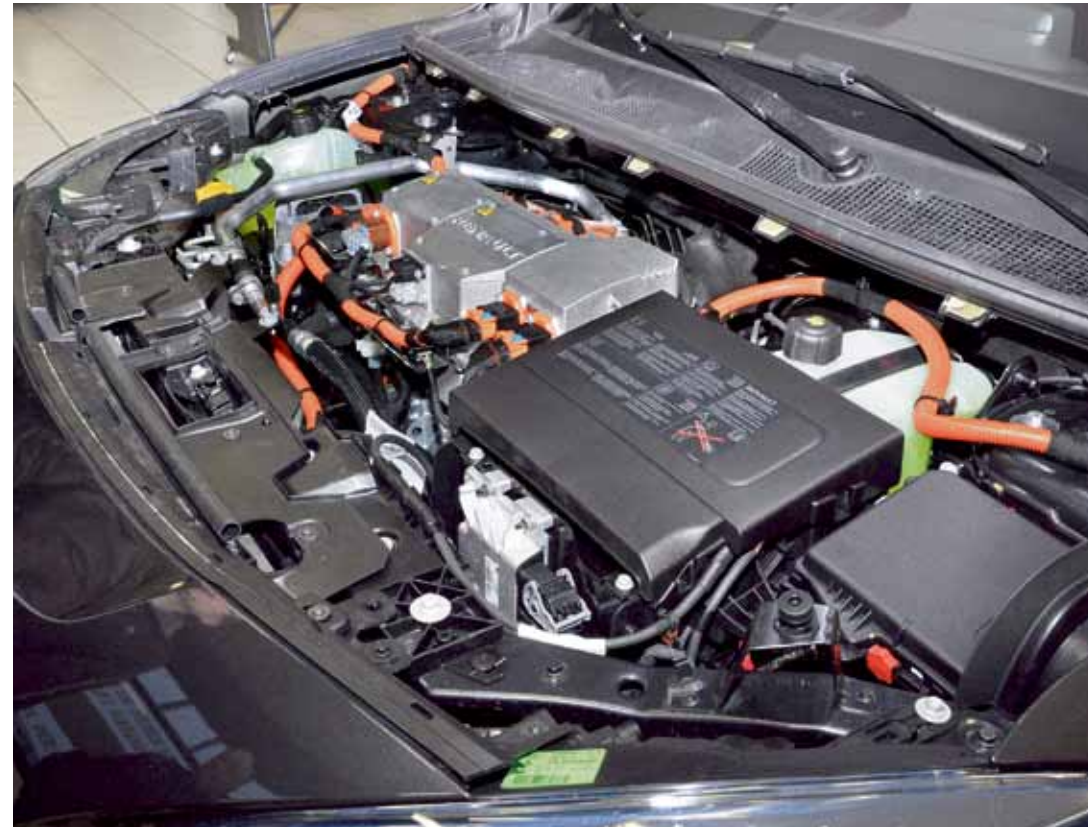
Der Renault Fluence Z.E. ist mit einem Elektromotor von 70 kW (95 PS) Leistung ausgestattet. Weil das maximale Drehmoment schon ab den ersten Metern zur Verfügung steht, gehört eine bis anhin ungekannte Beschleunigung zur Fahrfreude.