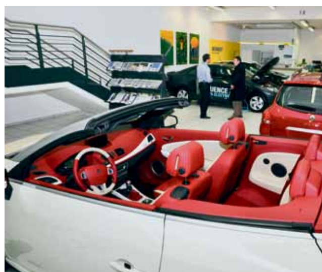
Renault Megane Coupé-Cabriolet: Auffallend dynamisch, sportlich und chic. Hier mit Lederinterieur und voll integriertem Navigationsgerät.