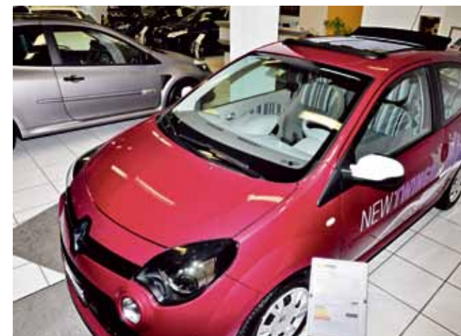
Der neue Renault Twingo Liberty bietet grosses Cabrio-Feeling für kleines Geld: Denn jetzt ist das Faltdach wieder da!