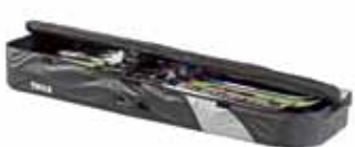
Faltbare Dachbox Thule Ranger 500 Preis Fr. 549.–

Jan./Feb. 2012: 10% auf diese zwei Artikel